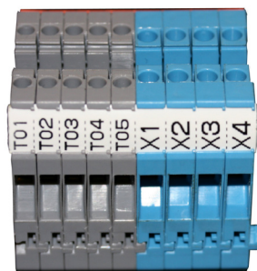
PP+ profil monterad på plint