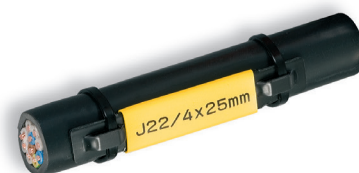
PO-068TW kabelmärkning på POH