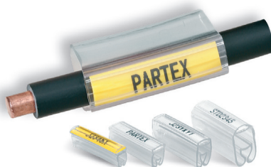
PP+ profil i PT+ hylsa