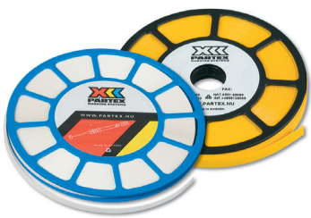
SN-rulle med PP+ profil