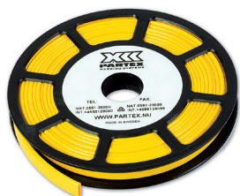
SN-rulle med PO profil