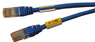
PP+ profil i PTC hylsa.